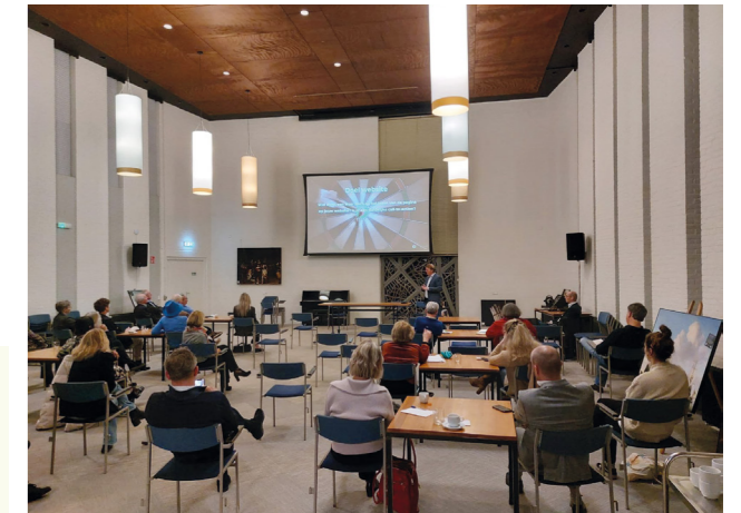
MKB Leidse regio: benut onze voucher t.w.v. 1000 euro Laat digitalisering voor je werken

Ruim 10.000 echo's per jaar worden er gemaakt in het Leidse Verloskundig Centrum De Poort. Echo's waarbij de timing ook nog eens heel nauw luistert. Daarvoor is een goed ingericht digitaal planningsstelsel nodig. Dat was een mooi project om mee aan de slag te gaan met behulp van Laat digitalisering voor je werken .